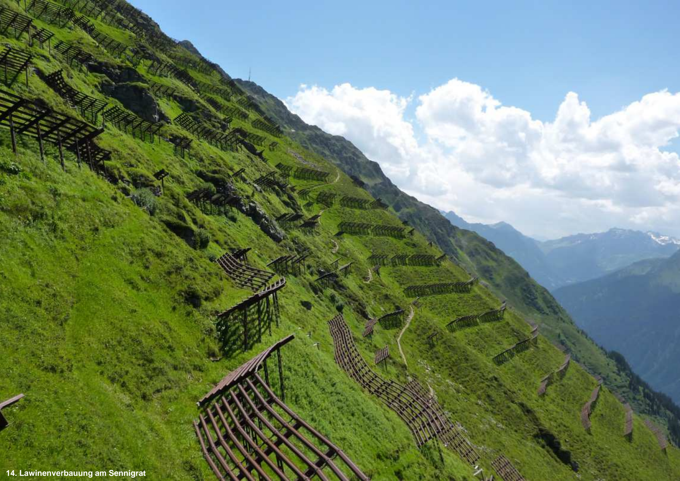
14. Lawinenverbauung am Sennigrat