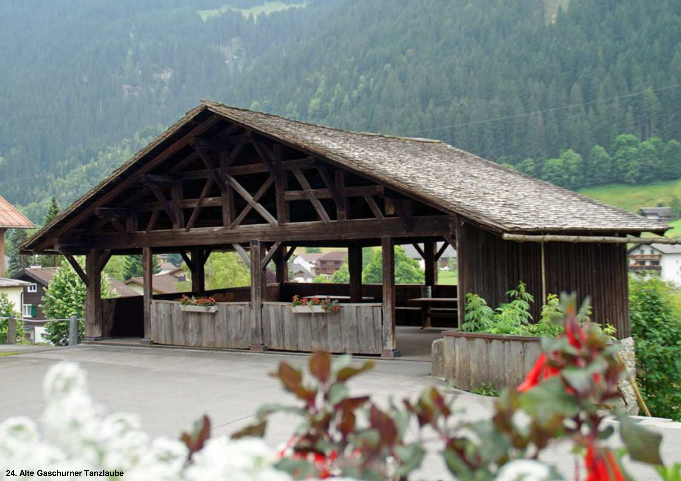
24. Alte Gaschurner Tanzlaube