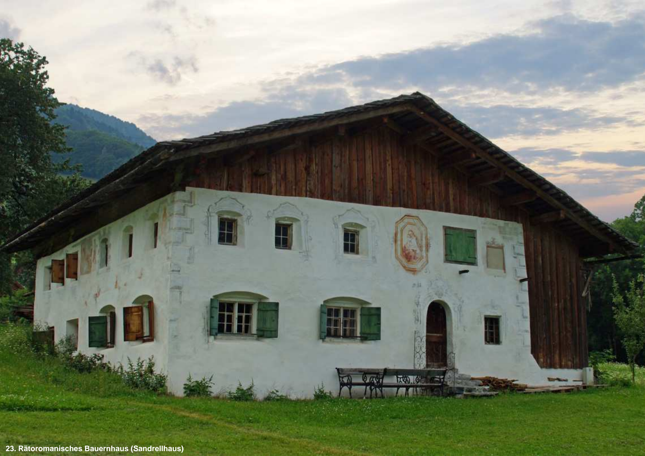
23. Rätomanisches Bauernhaus (Sandrellhaus)