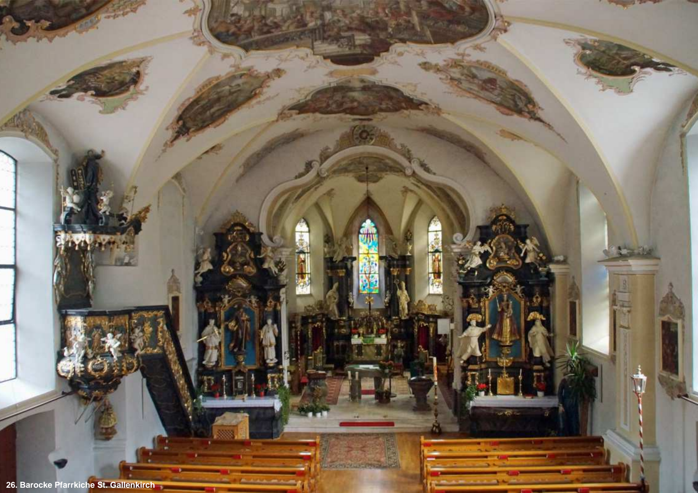
26. Barocke Pfarrkirche St. Gallenkirch