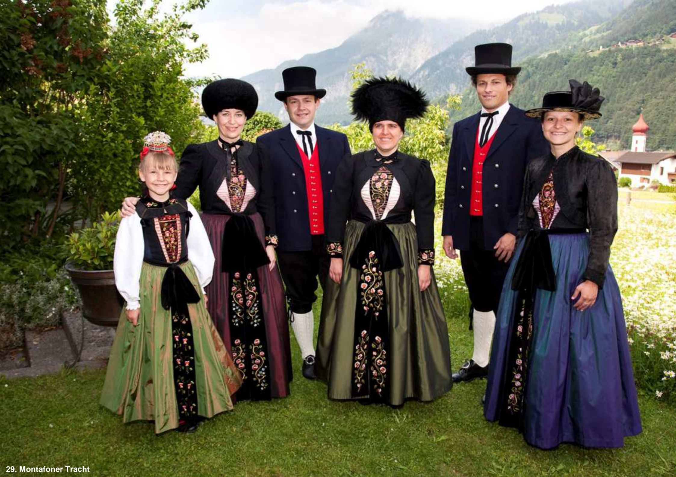
29. Montafoner Tracht