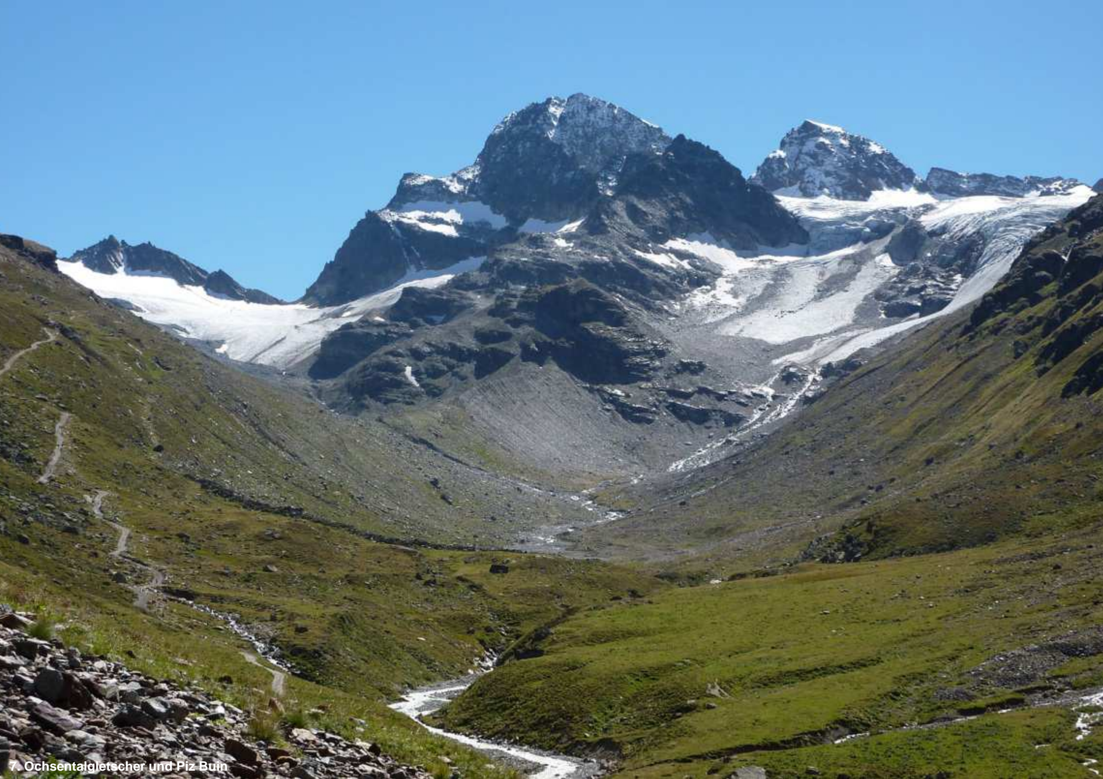
7. Ochsentalgletscher und Piz Buin