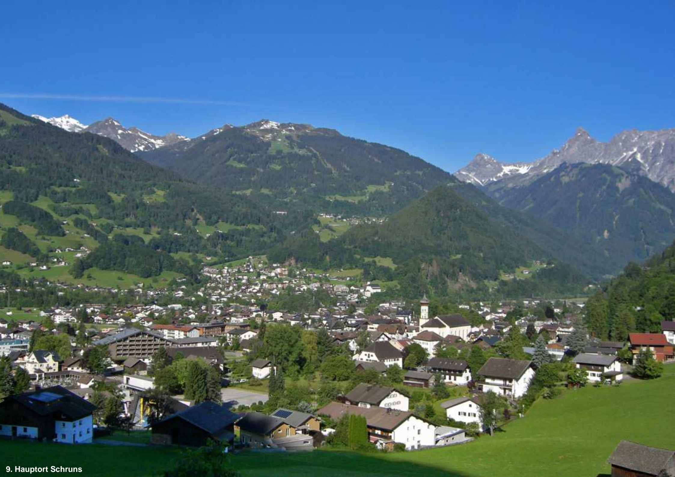
9. Hauptort Schruns