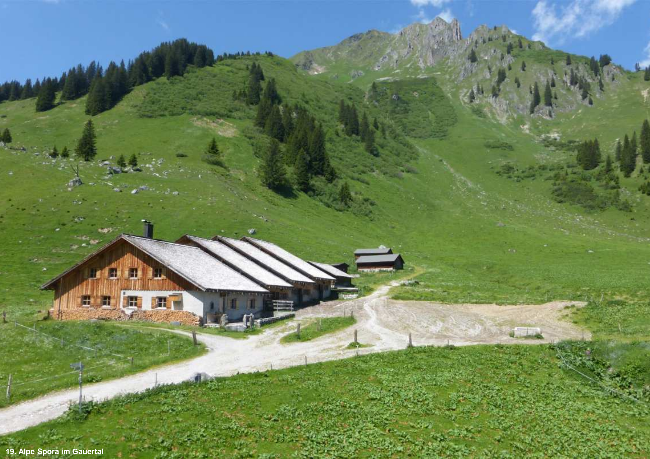
19. Alpe Spora im Gauertal