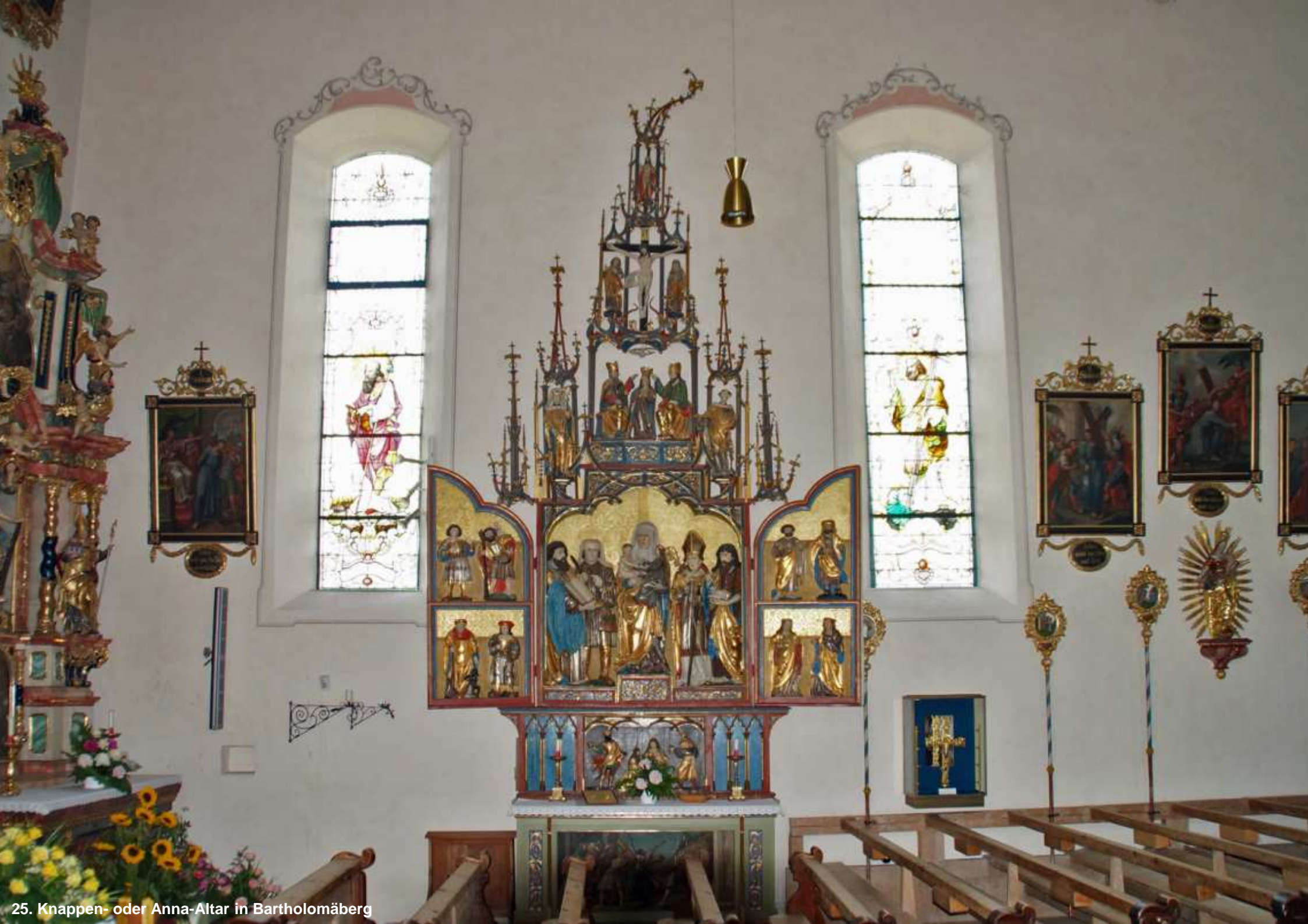
25. Knappen- oder Anna-Altar in Bartholomäberg