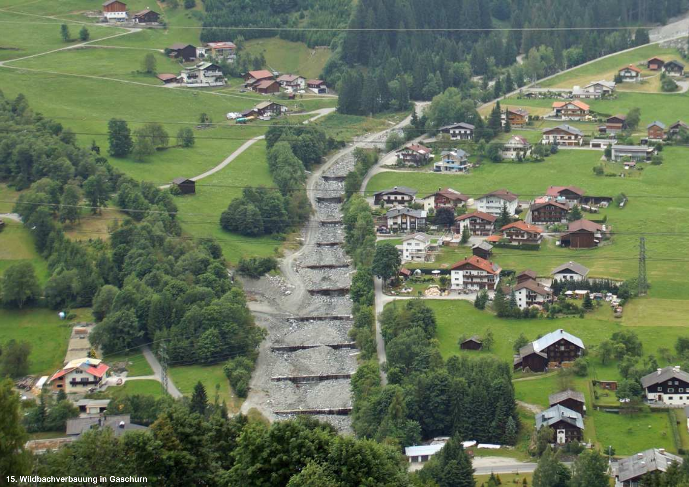
15. Wildbachverbauung in Gaschurn