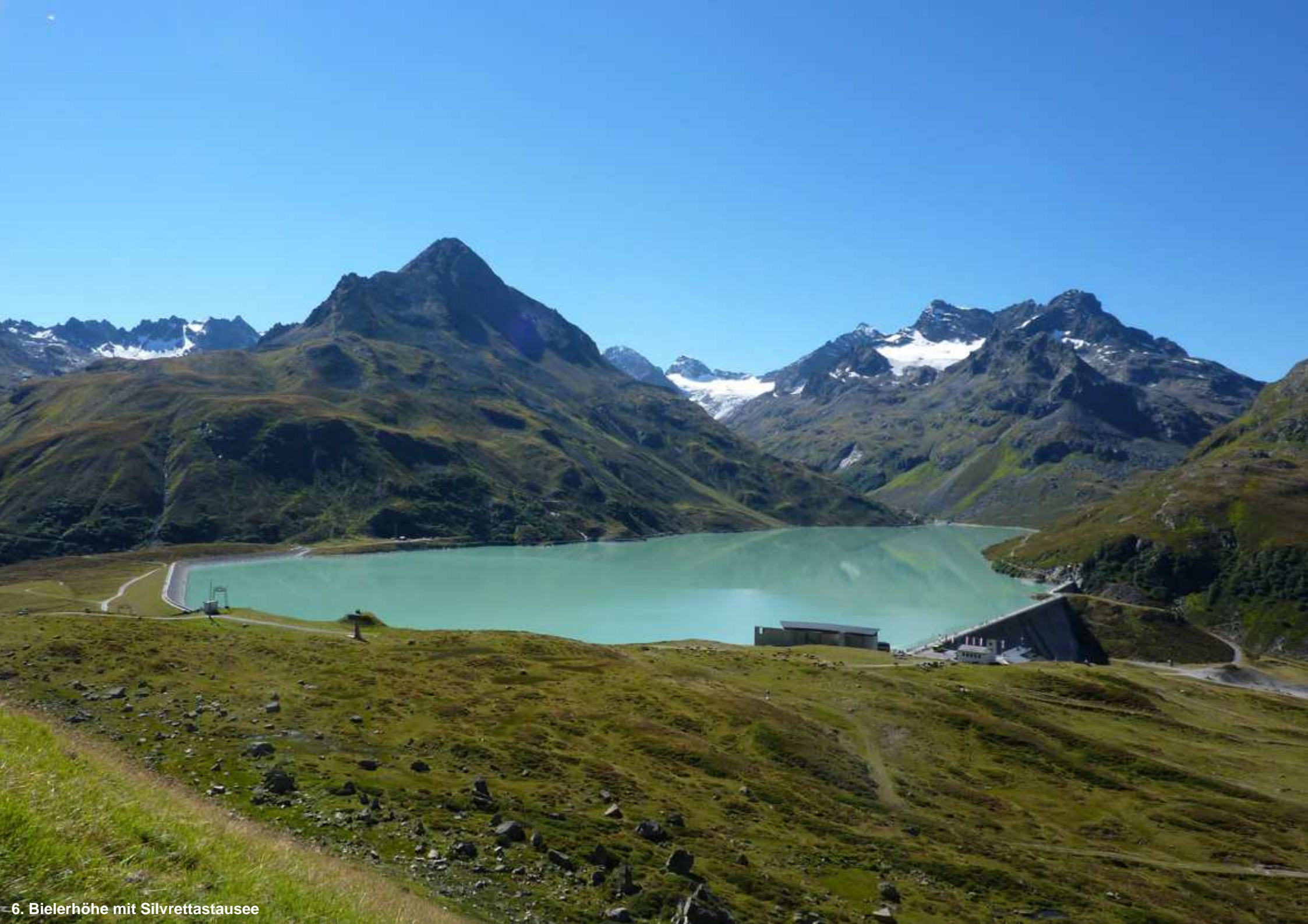
6. Bielerhöhe mit Silvrettastausee