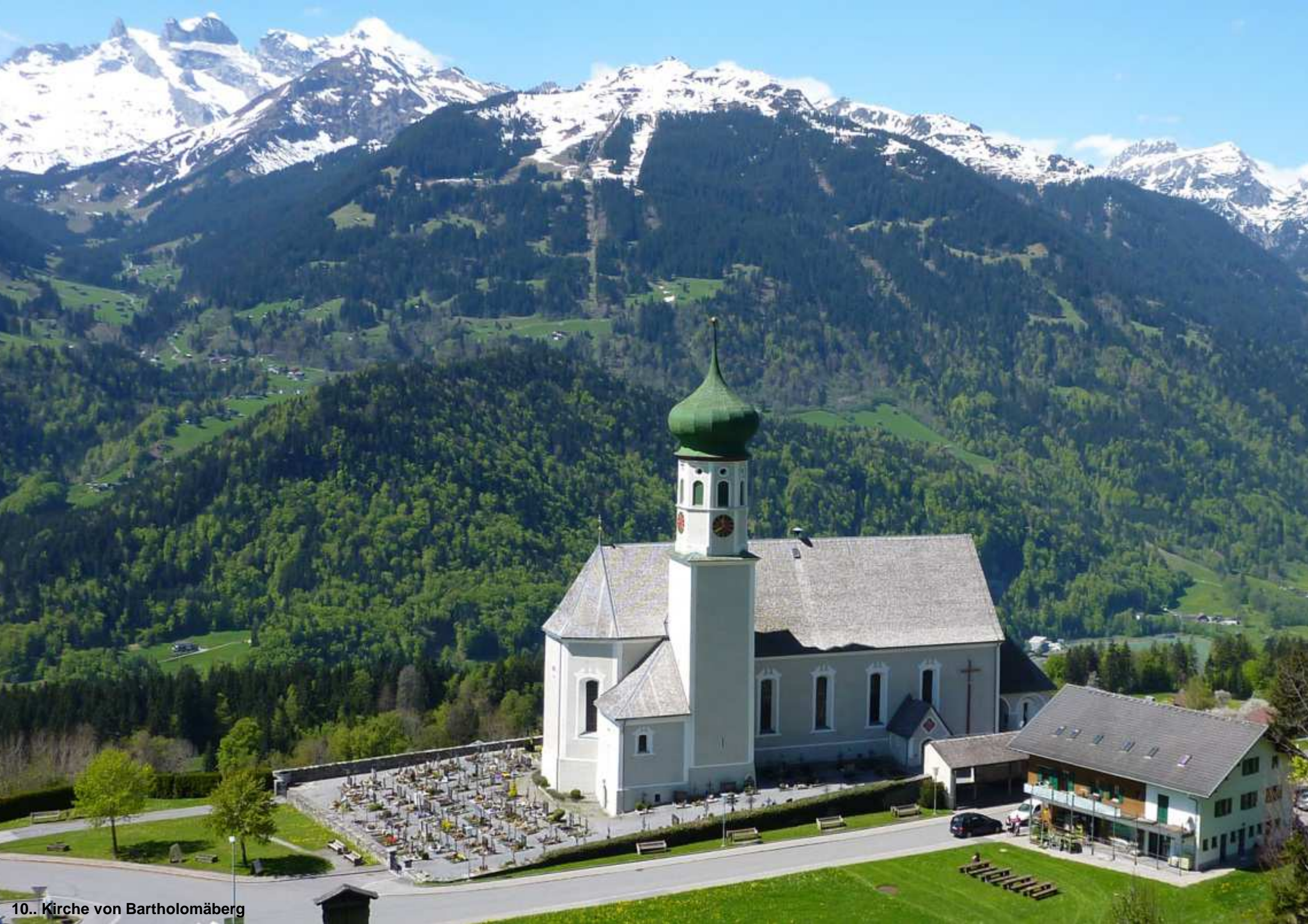
10.. Kirche von Bartholomäberg