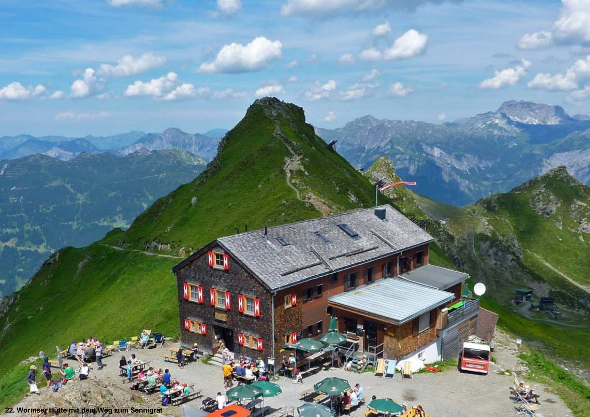
22. Wormser Hütte mit dem Weg zum Sennigrat