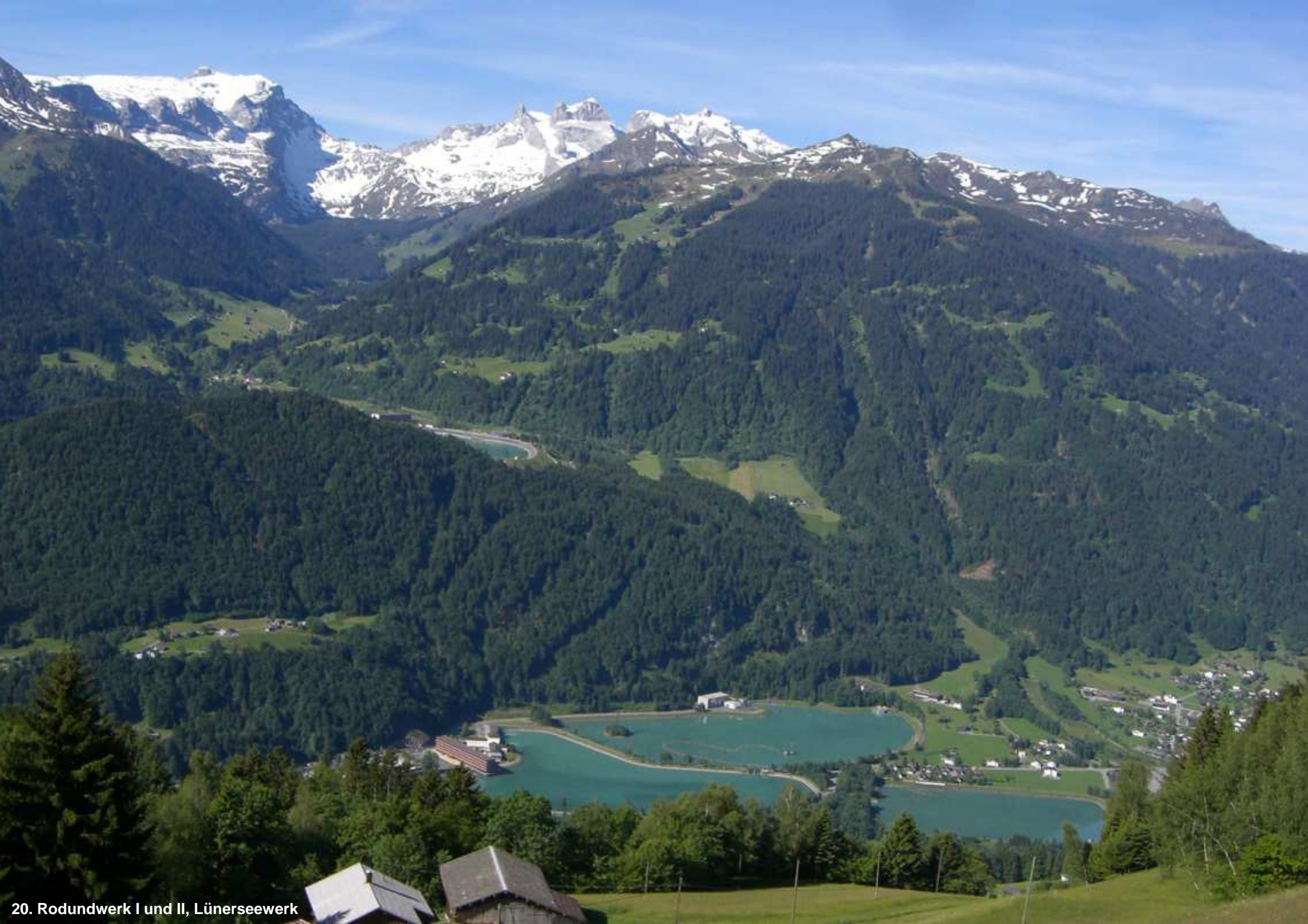
20. Rodundwerk I und II, Lünserseewerk