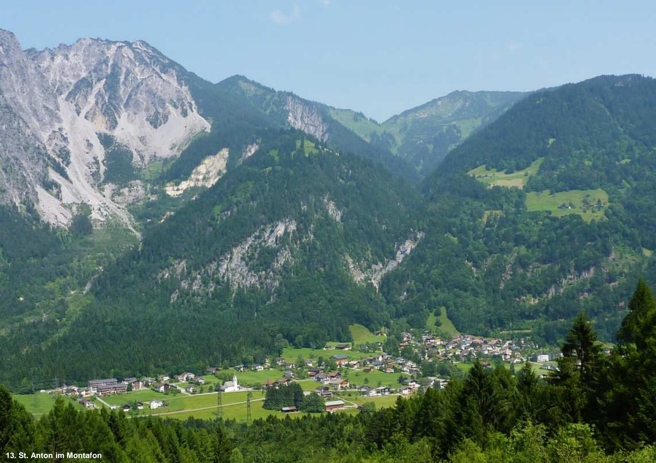
13. St. Anton im Montafon