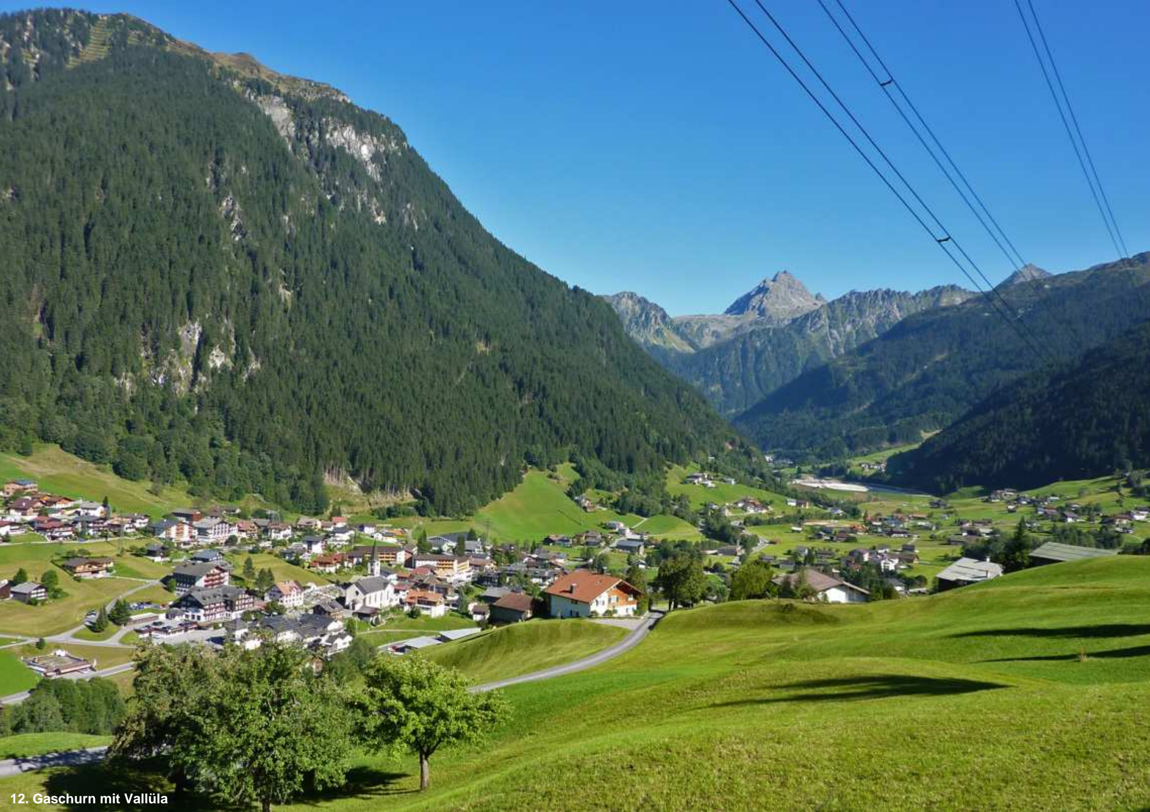
12. Gaschurn mit Vallüla