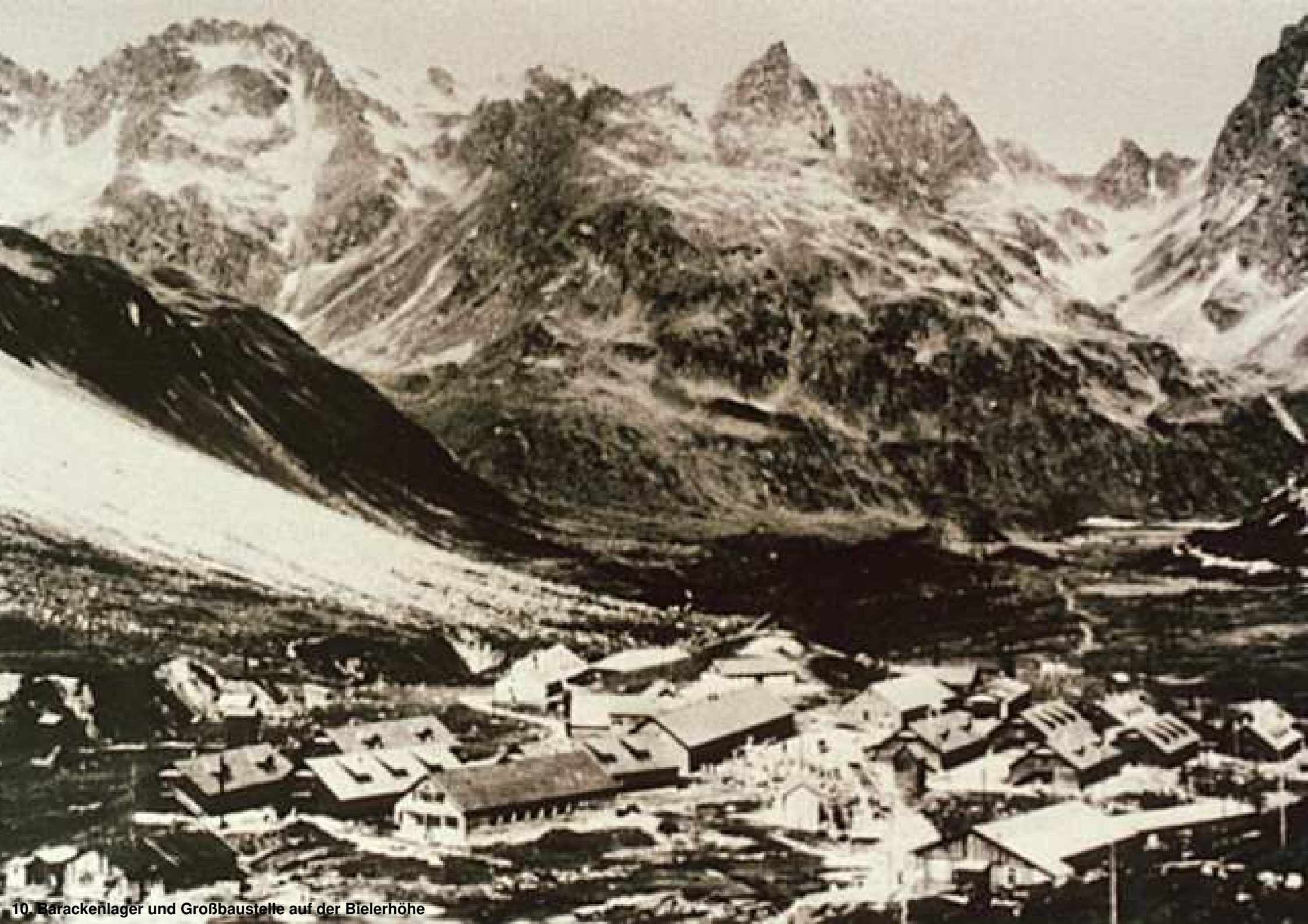
10. Barackenlager und Großbaustelle auf der Bielerhöhe