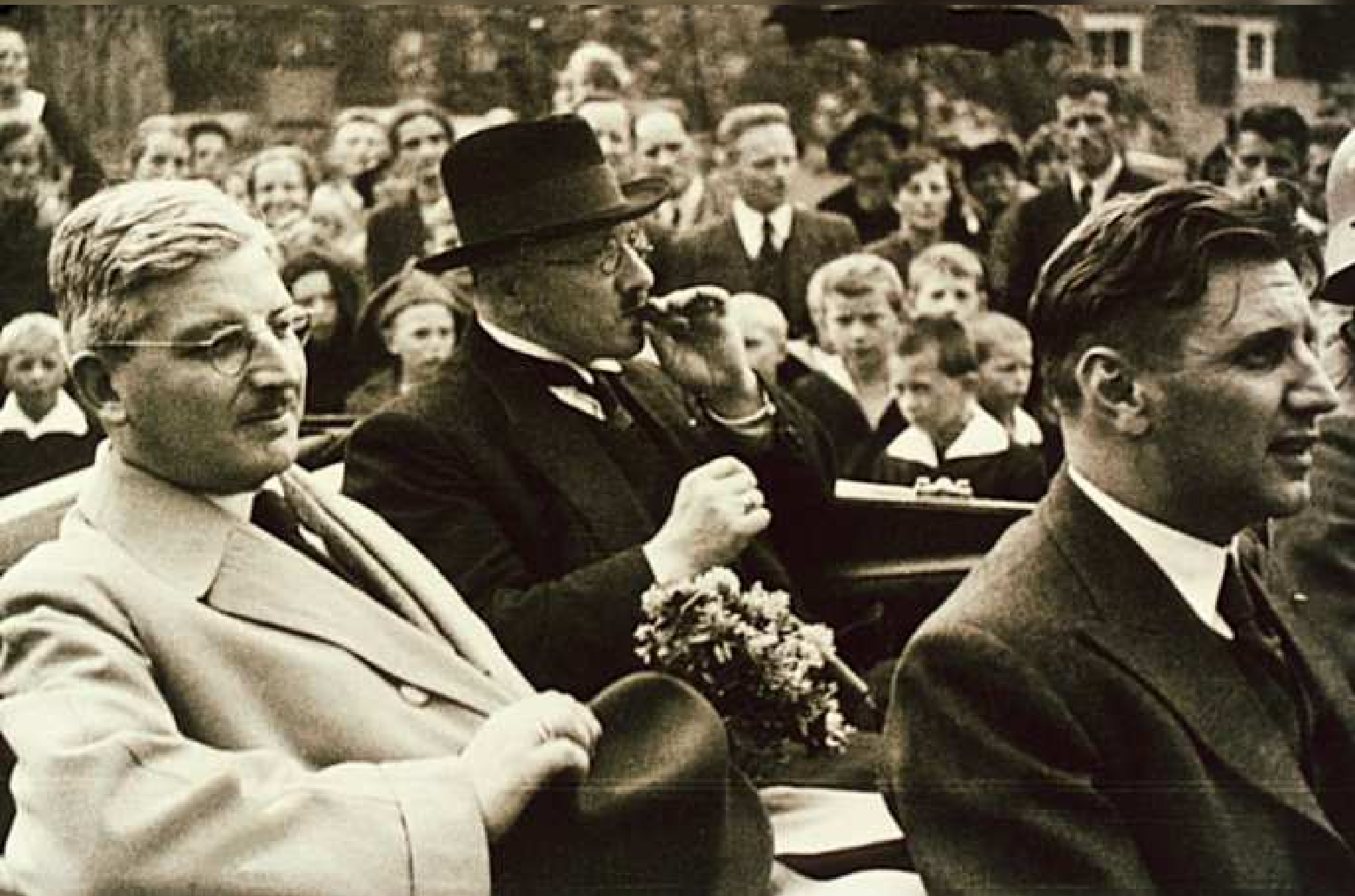
2. Kanzler Schuschnigg, Landeshauptmann Winsauer und Eduard Ulmer