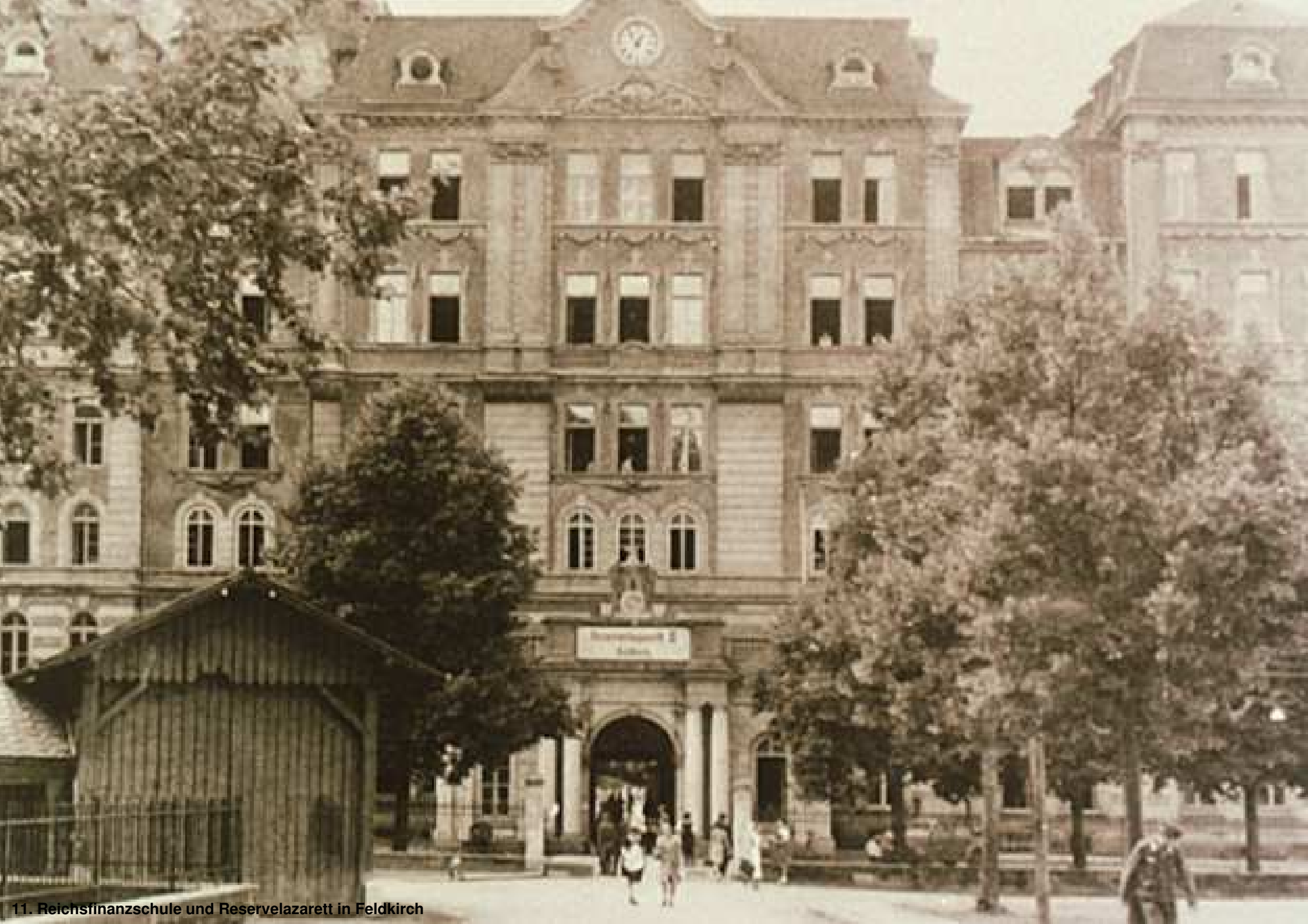
11. Reichsfinanzschule und Reservelazarett in Feldkirch