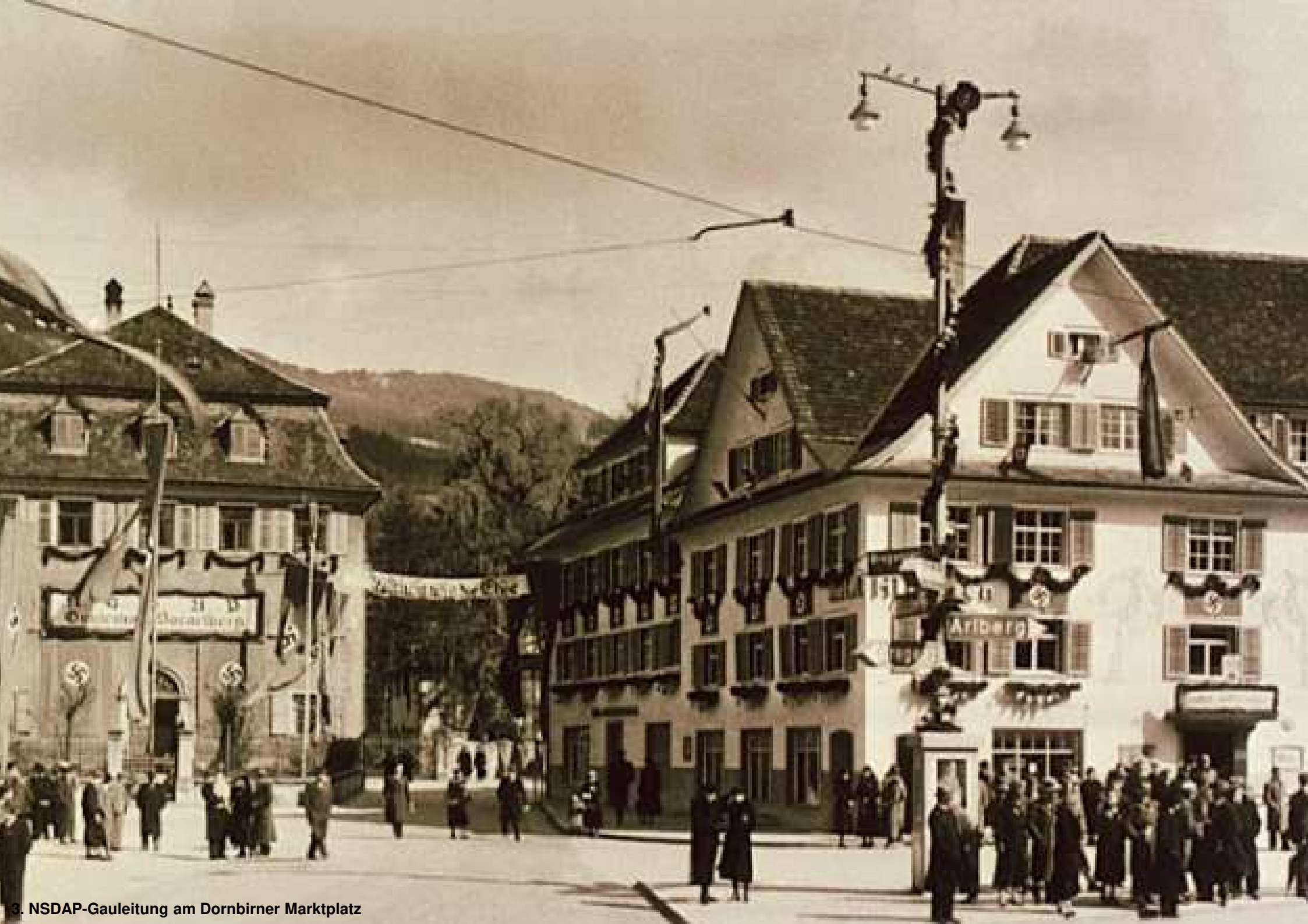
3. NSDAP-Gauleitung am Dornbirner Marktplatz