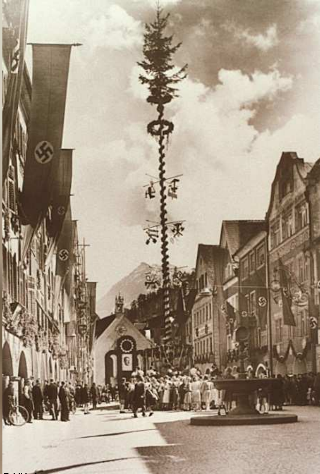
9. „Ehrenbogen“ zu Hitlers 50. Geburtstag in Feldkirch