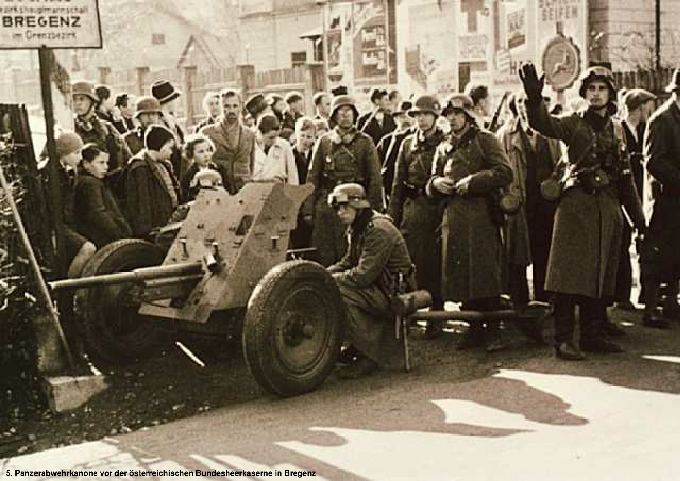
5. Panzerabwehrkanone vor der österreichischen Bundesheerkaserne in Bregenz