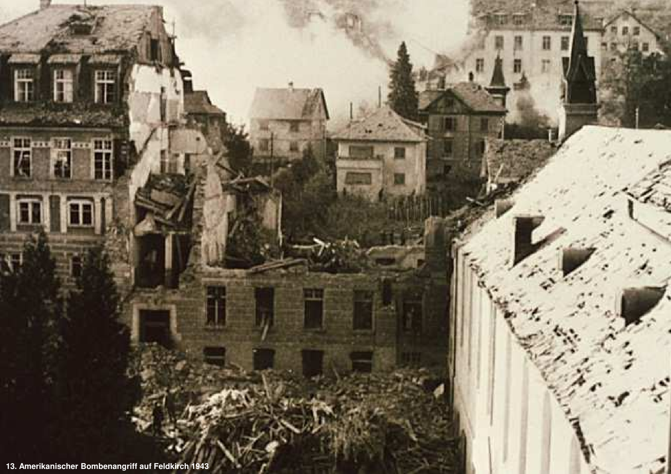
13. Amerikanischer Bombenangriff auf Feldkirch 1943