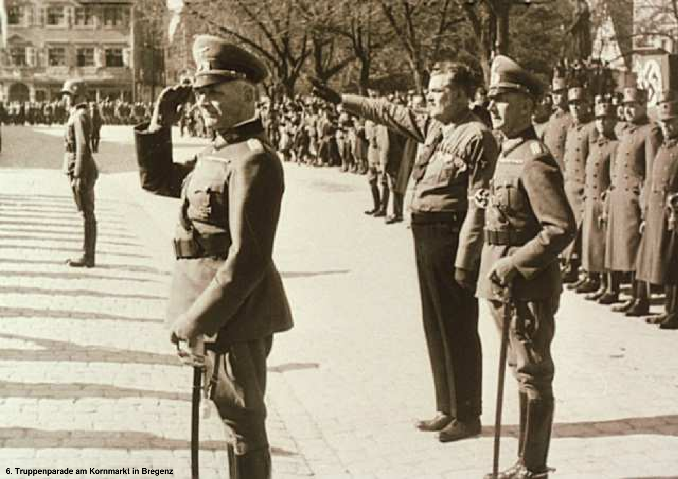
6. Truppenparade am Kornmarkt in Bregenz