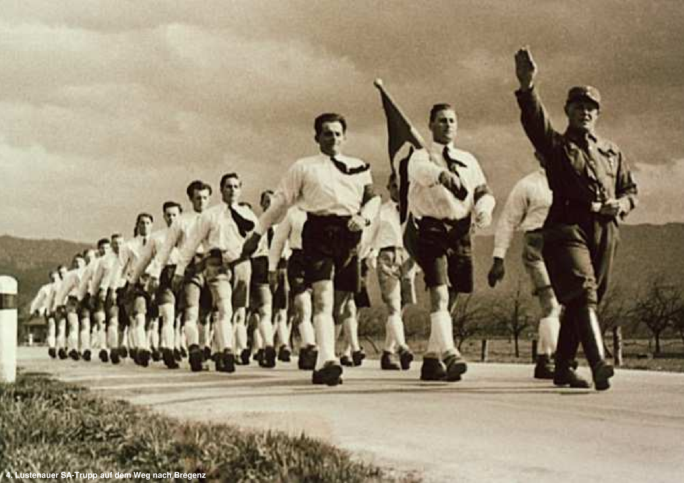
4. Lustenauer SA-Trupp auf dem Weg nach Bregenz