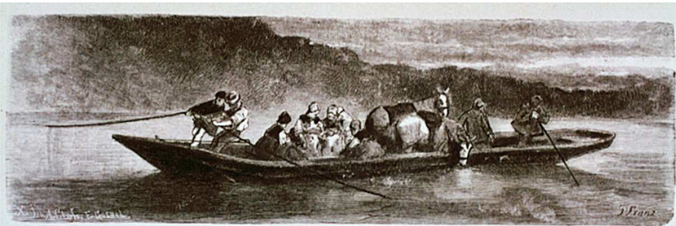
Vaart over den Rijn bij Riithl.