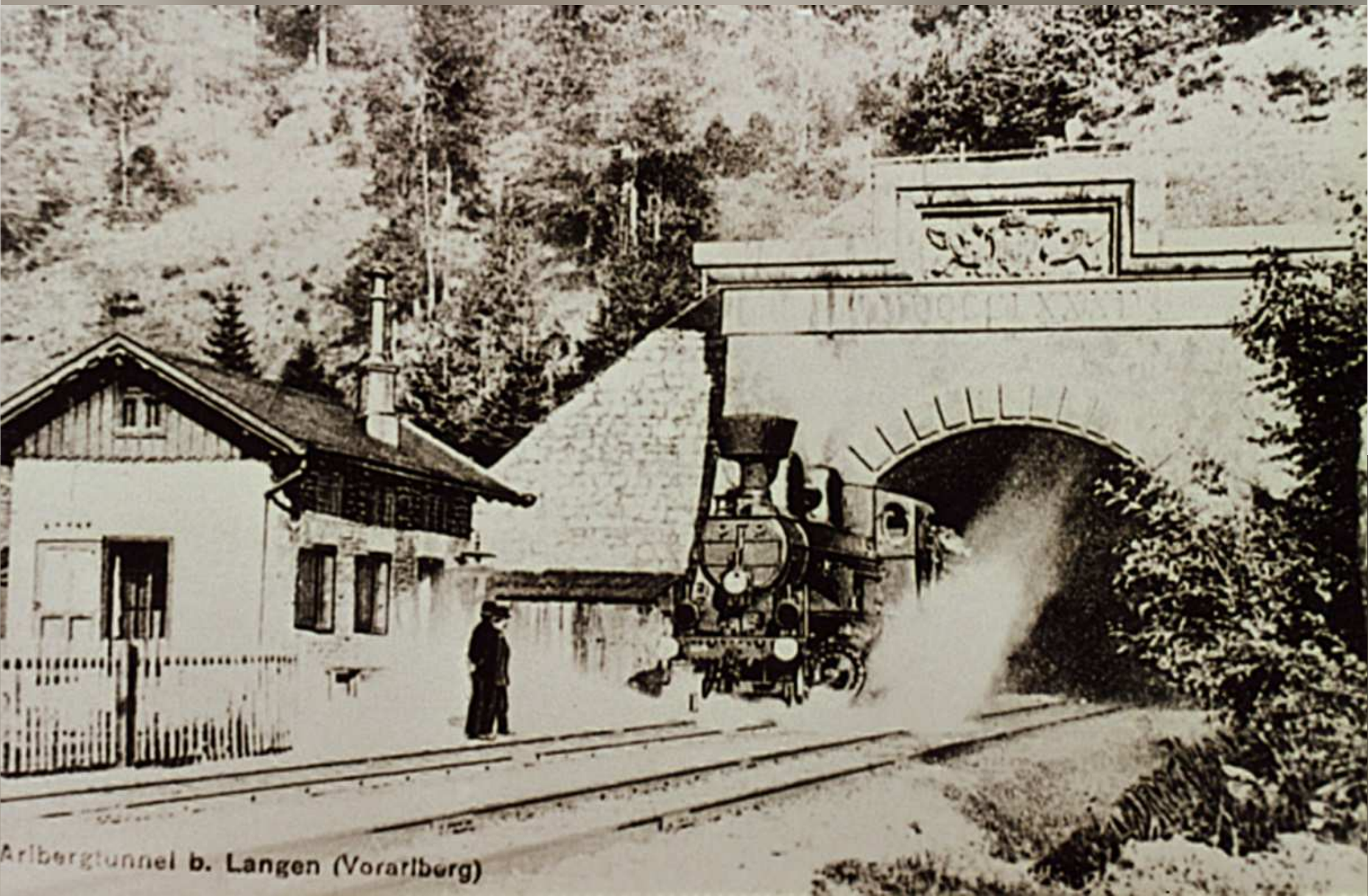
Arlbergtunnel b. Langen (Vorarlberg)