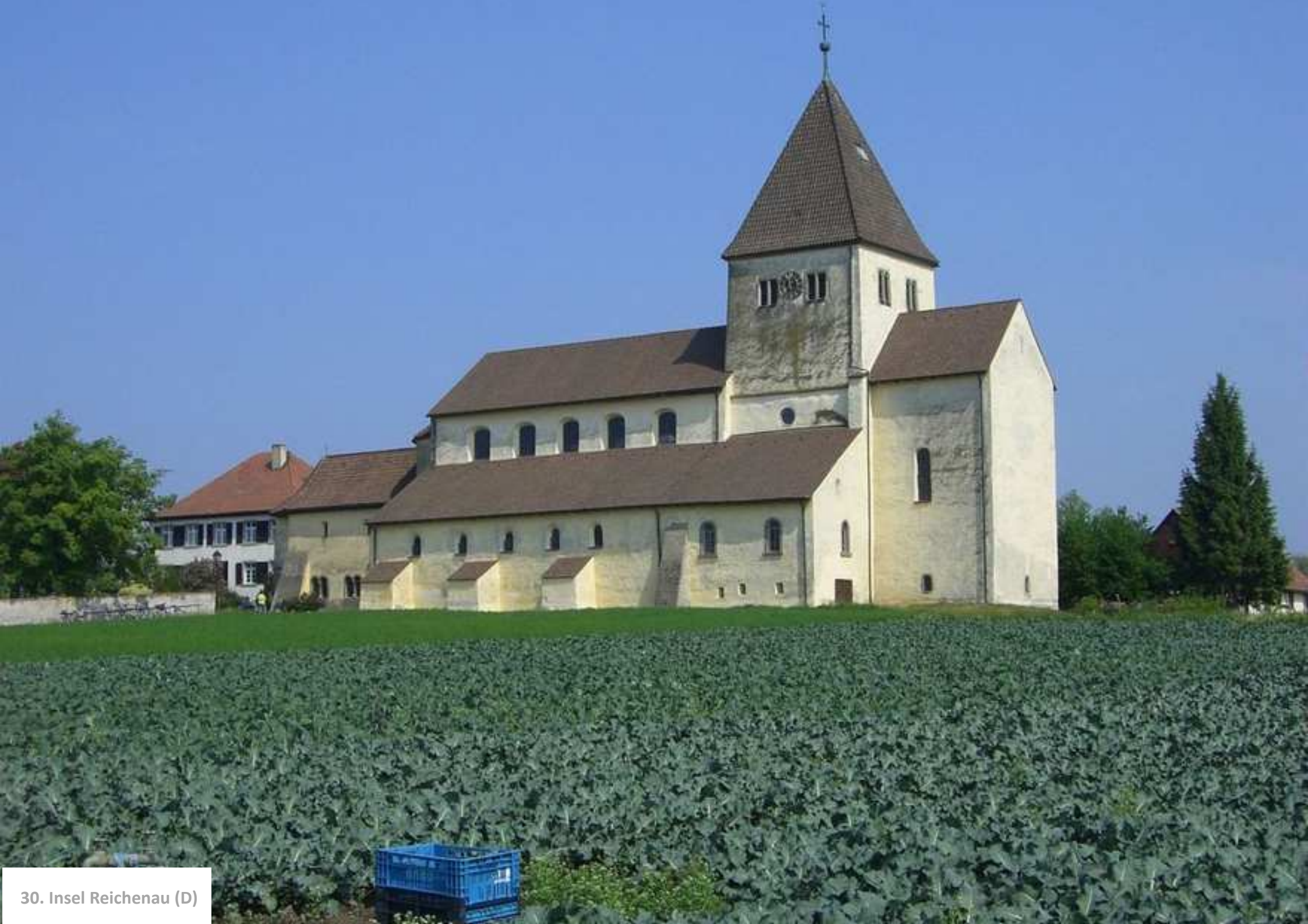
30. Insel Reichenau (D)