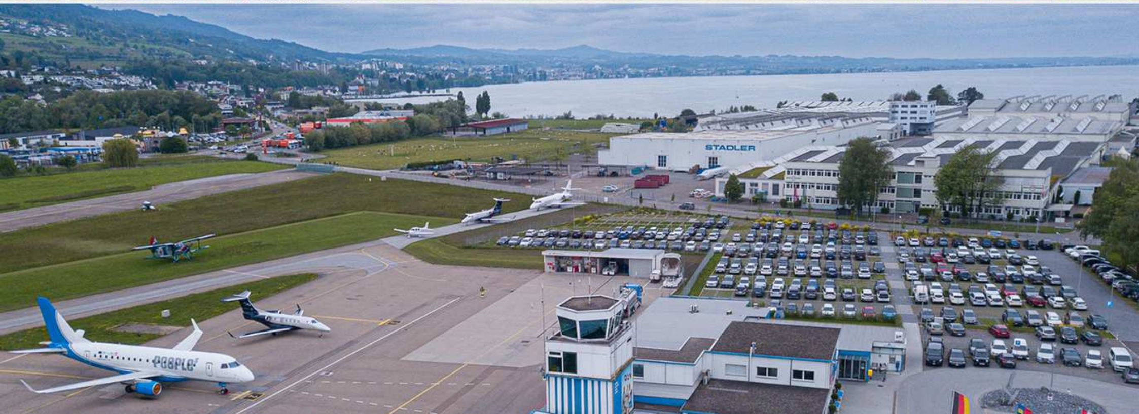
11. Flughäfen Friedrichshafen (D) und St. Gallen-Alpenrhein (CH)