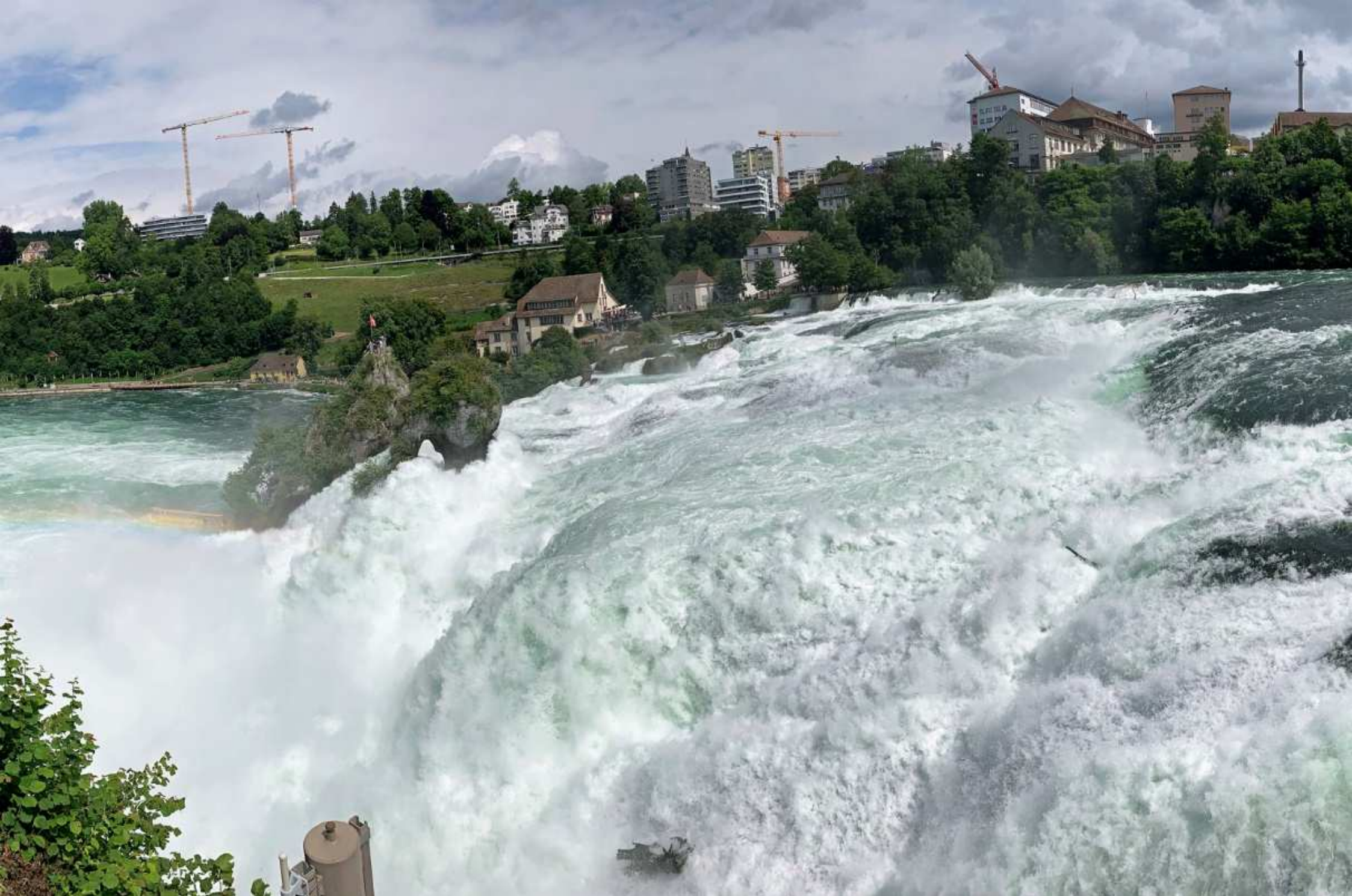
31. Rheinfall bei Schaffhausen (CH)