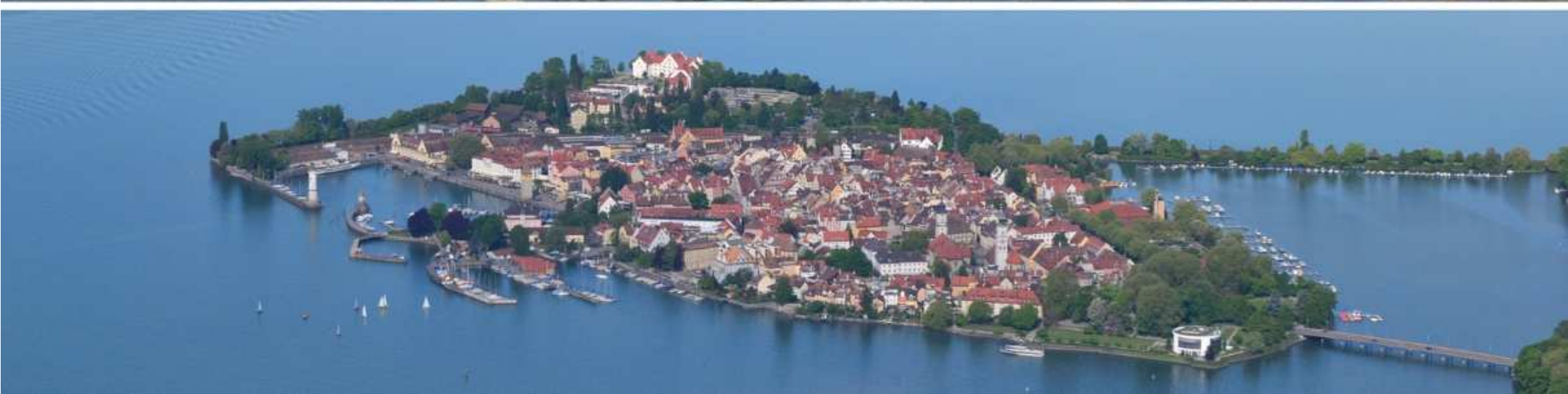
21. Lindau (D) - Hafeneinfahrt