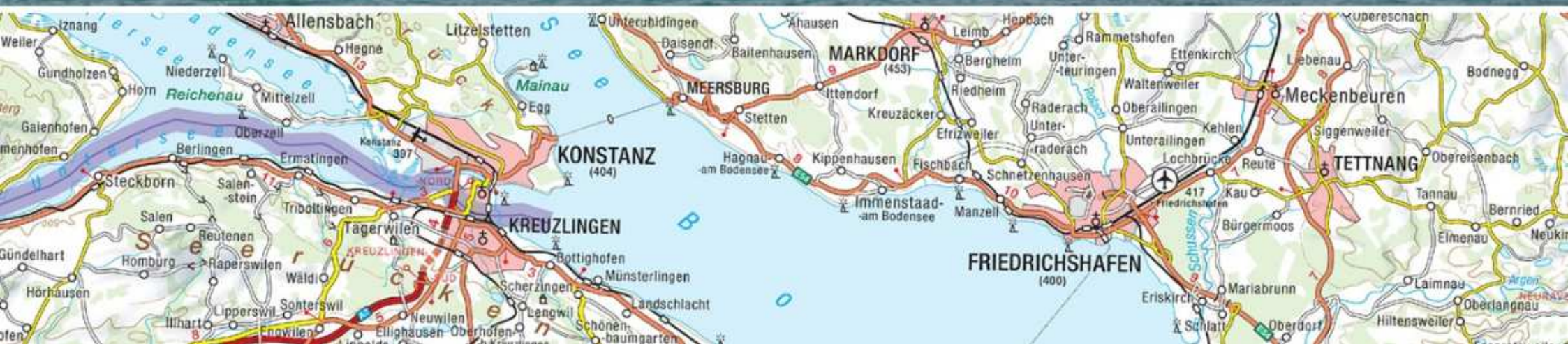
24. Konstanz (D)