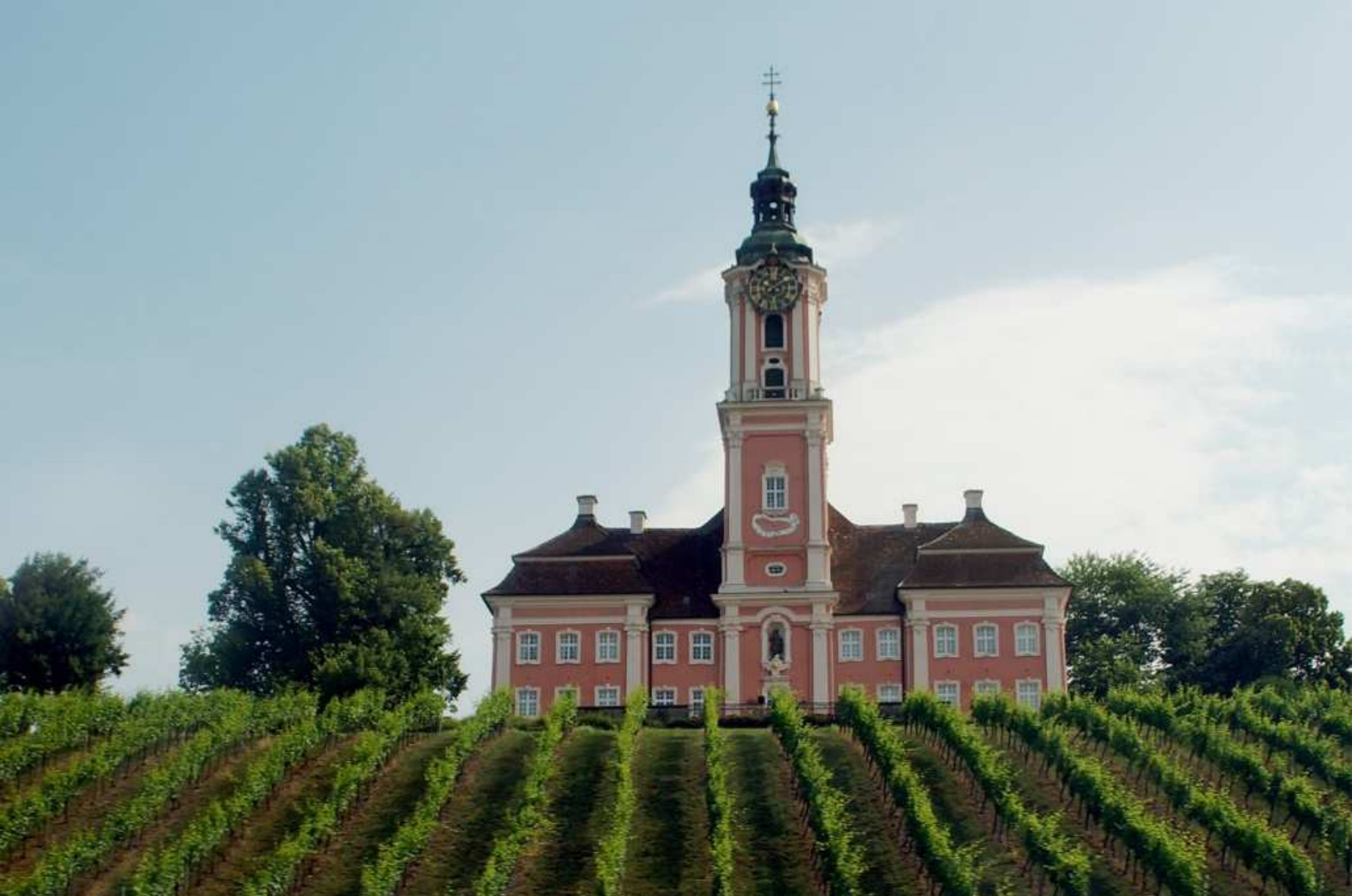
28a. Wallfahrtskirche Birnau (D)