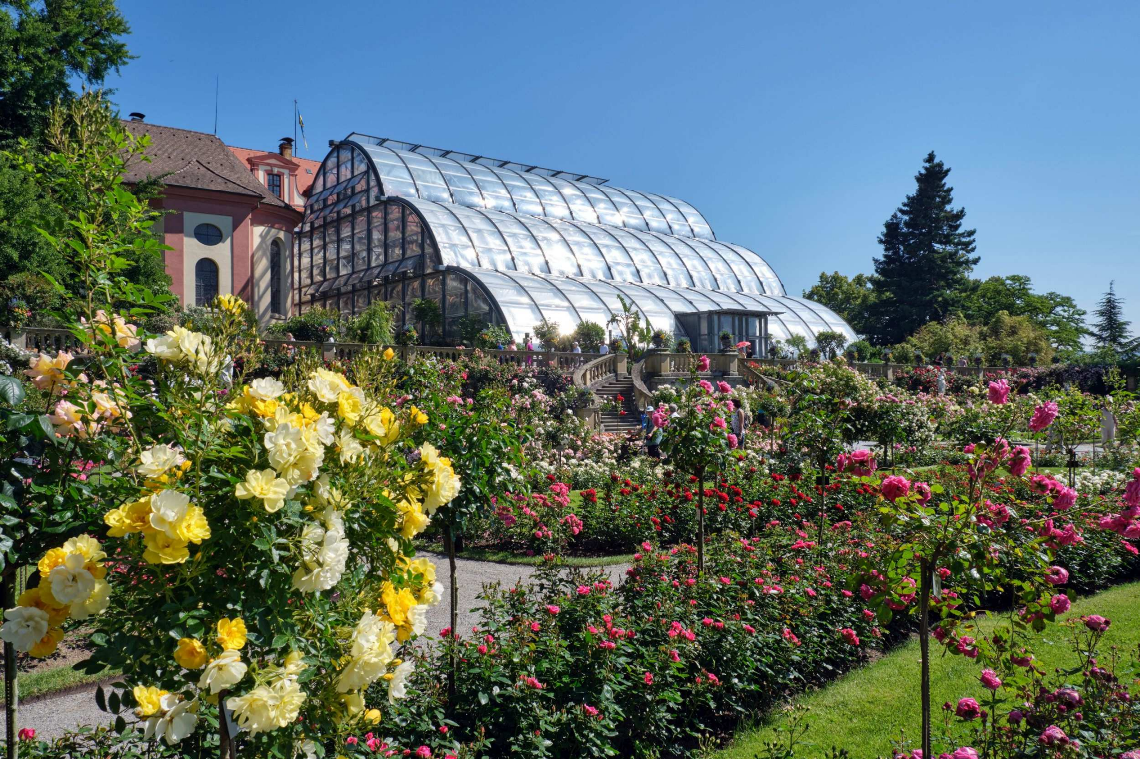
26b. Blumenparadies auf der Insel Mainau (D)