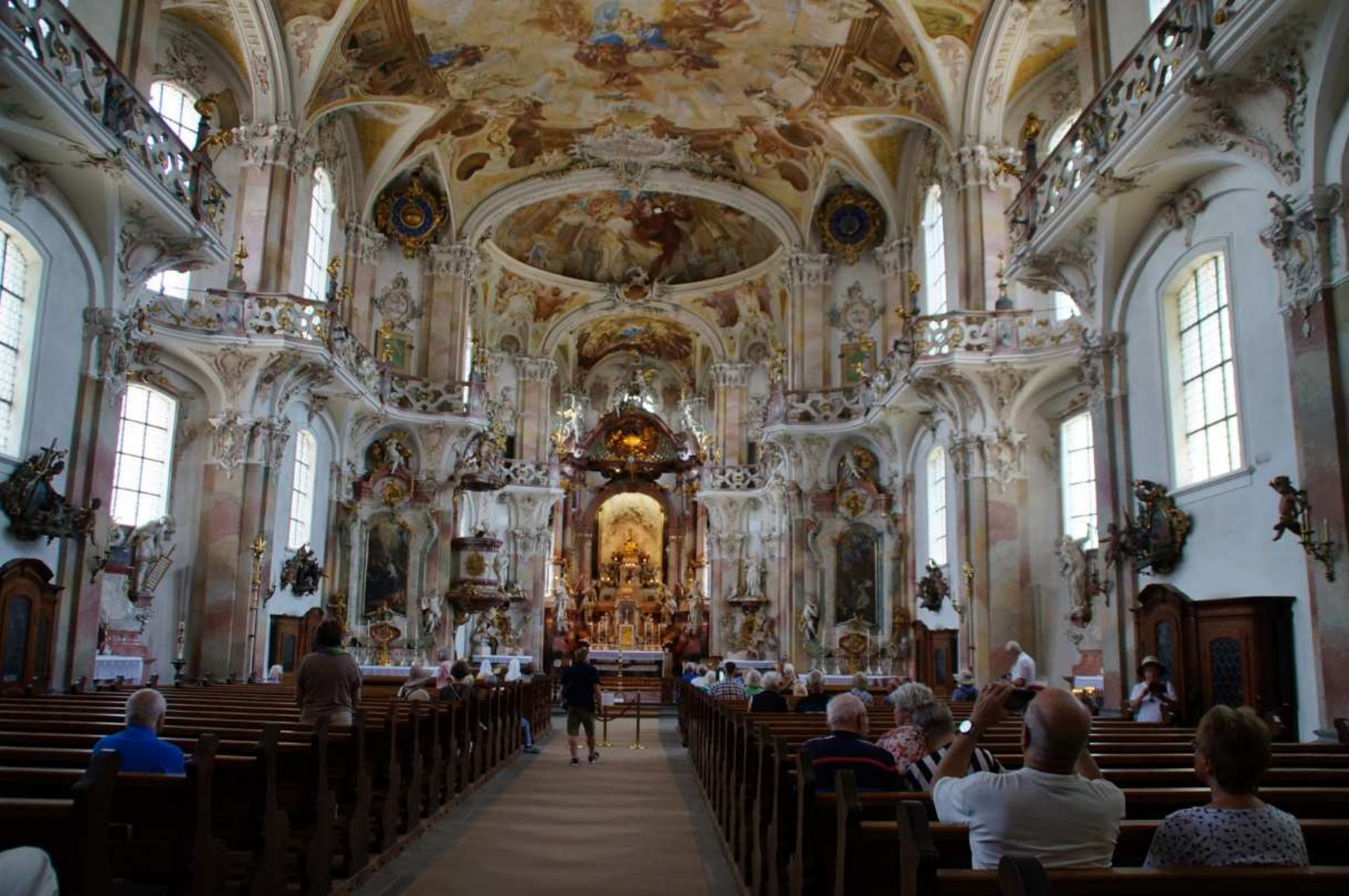
28b. Wallfahrtskirche Birnau (D) - Innenansicht