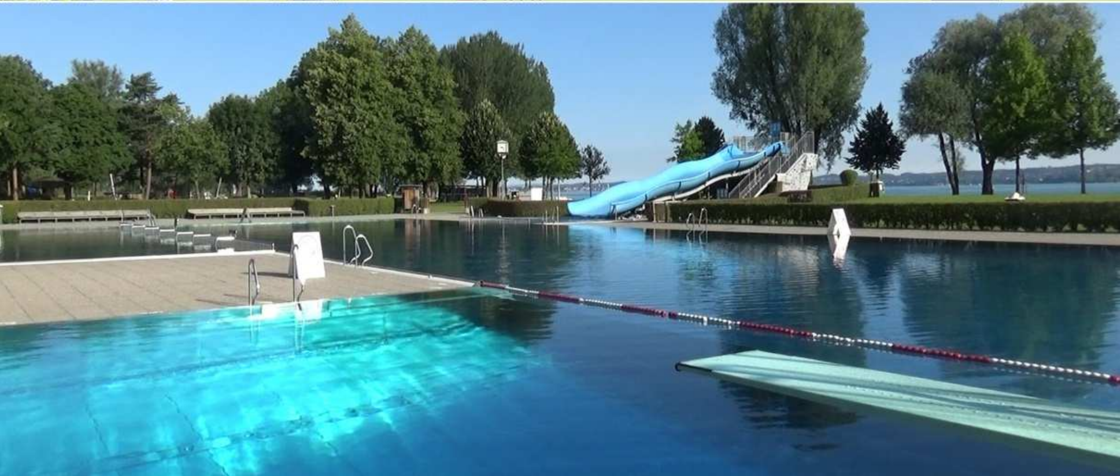
19. Badestrände in Vorarlberg