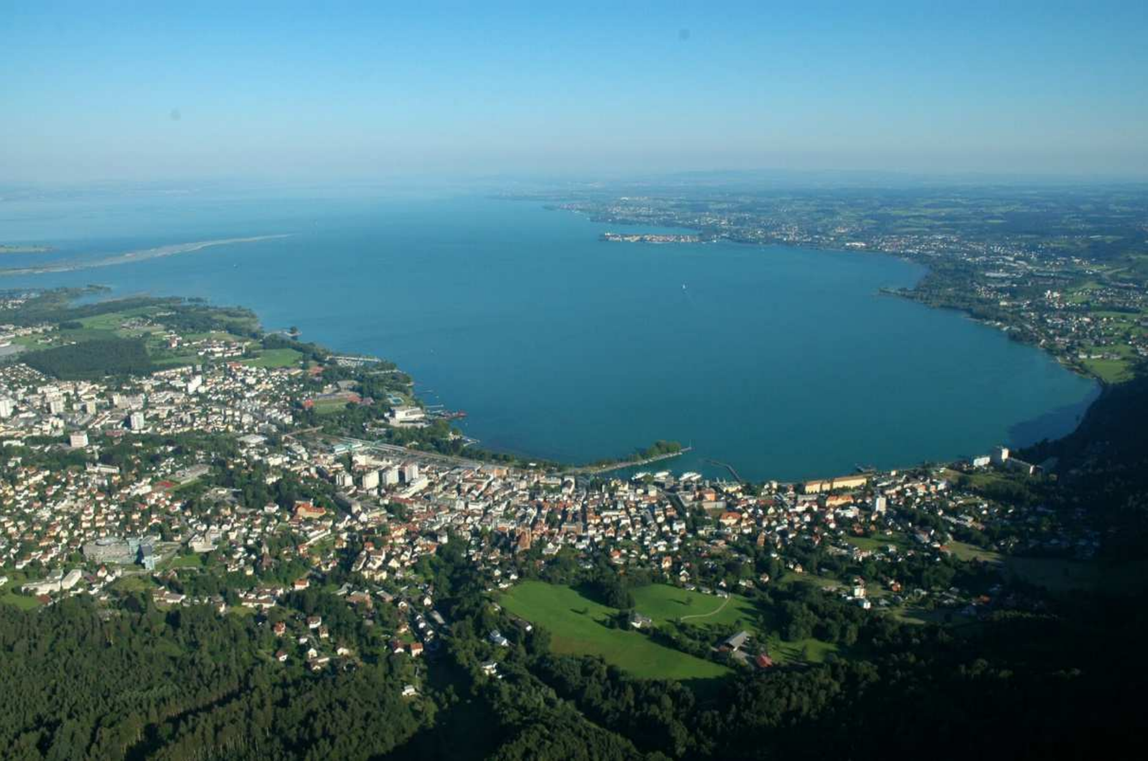
15. Bregenzer Bucht