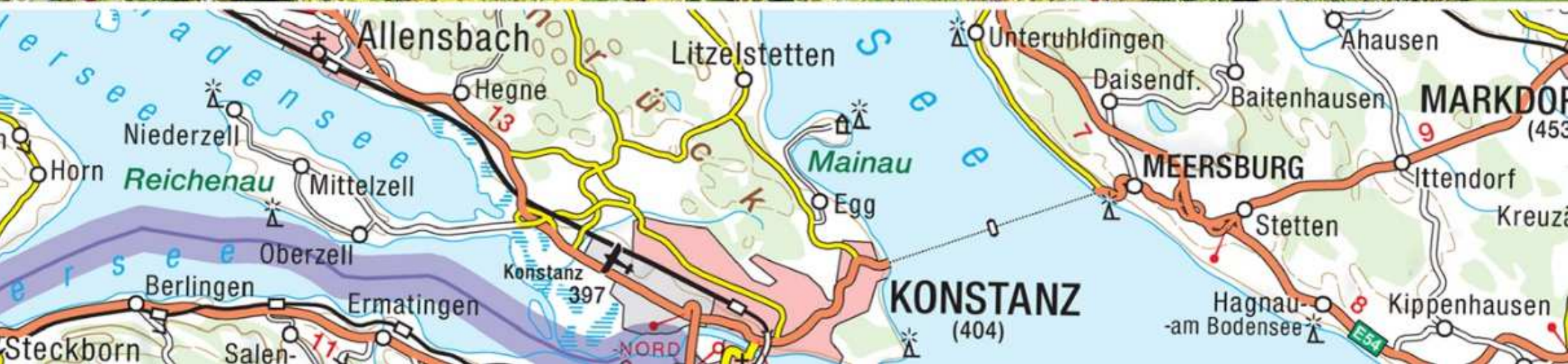
26a. Blumenparadies auf der Insel Mainau (D)