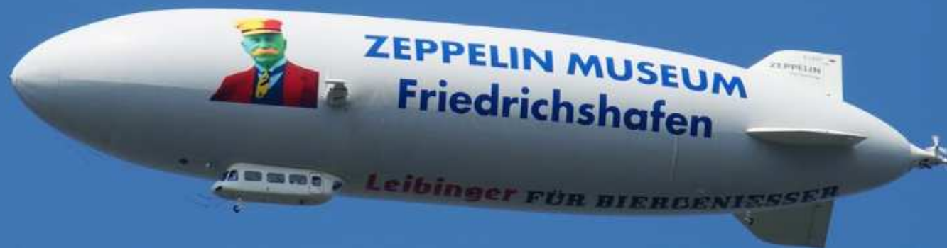
22. Zeppelinmuseum in Friedrichshafen (D)