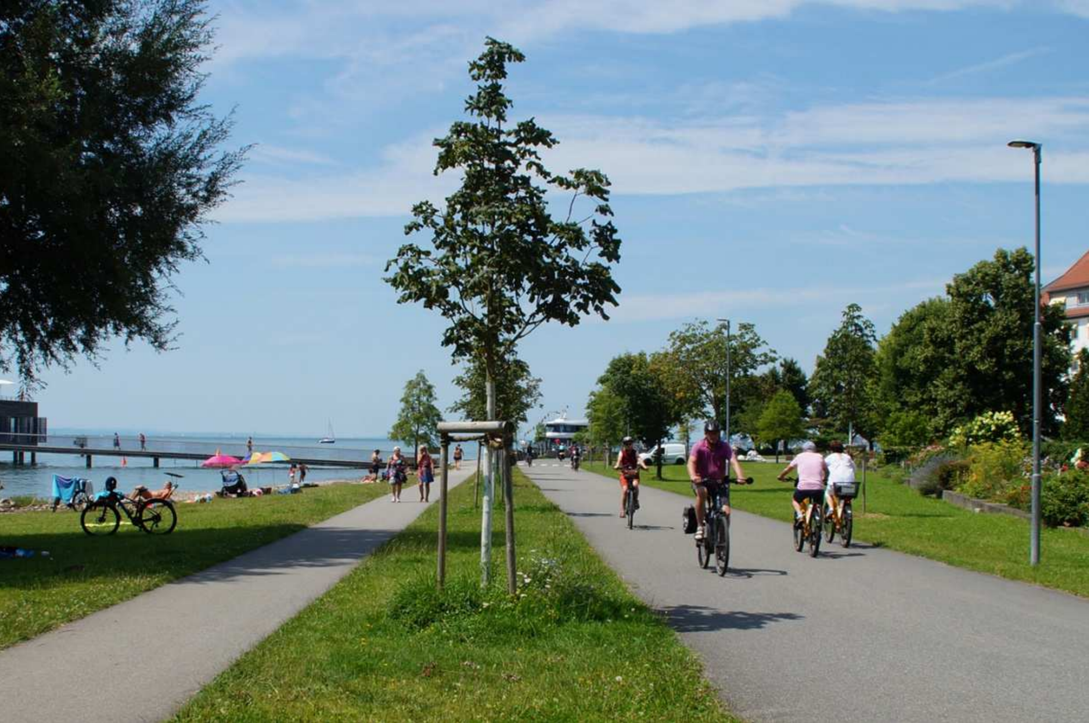
08. Geh- und Radwege um den Bodensee