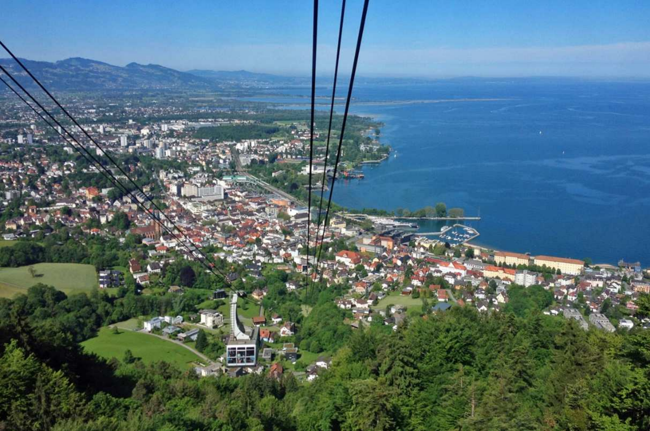
17. Aussichtspunkt Pfänder