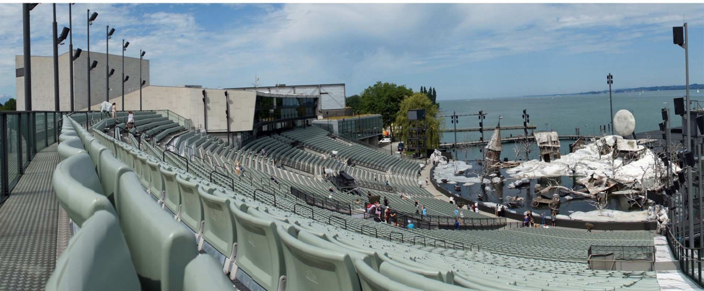
20. Festspielhaus und Seebühne