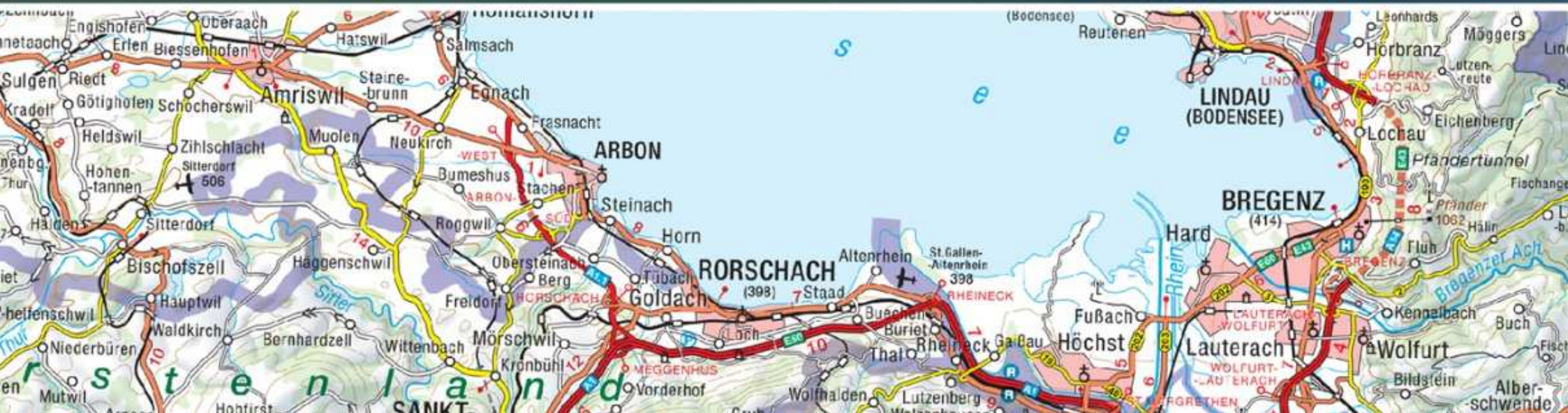
16. Südufer des Bodensees mit Rheindelta