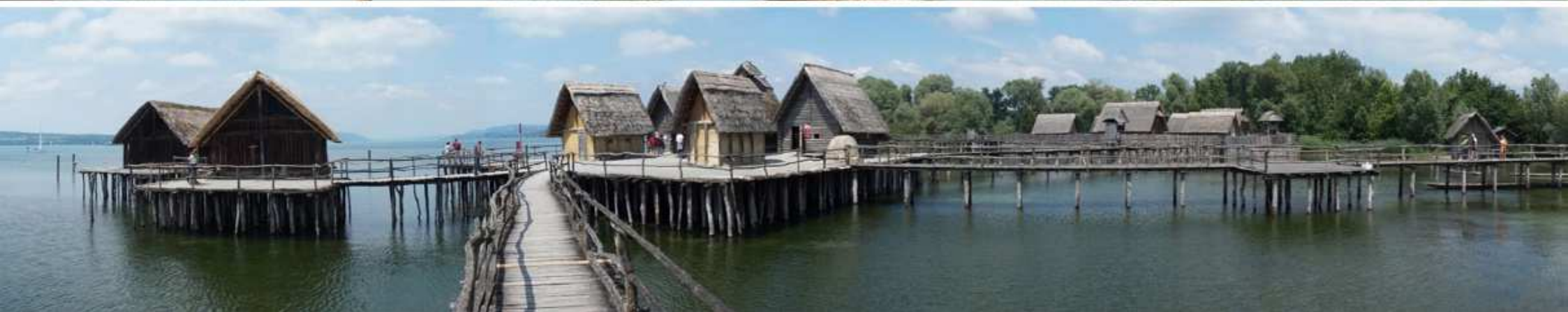
27. Pfahlbauten in Unteruhldingen (D)